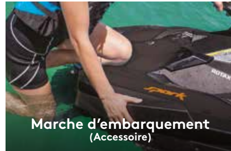
Marche d'embarquement (Accessoire)

Conçu pour améliorer la liberté de mouvement lors de la conduite.