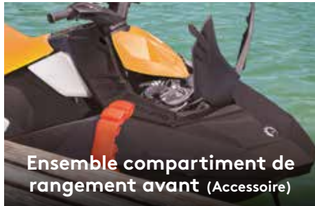
Ensemble compartiment de rangement avant (Accessoire)

Choix de deux moteurs Rotax® économes en carburant, compacts et légers.