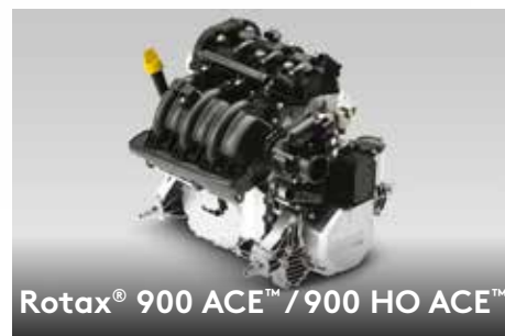
Rotax® 900 ACE™ / 900 HO ACE™

Matériau innovant qui réduit le poids tout en optimisant la performance et l'efficacité. Les coques moulées sont plus résistantes aux rayures que celles en fibre de verre.